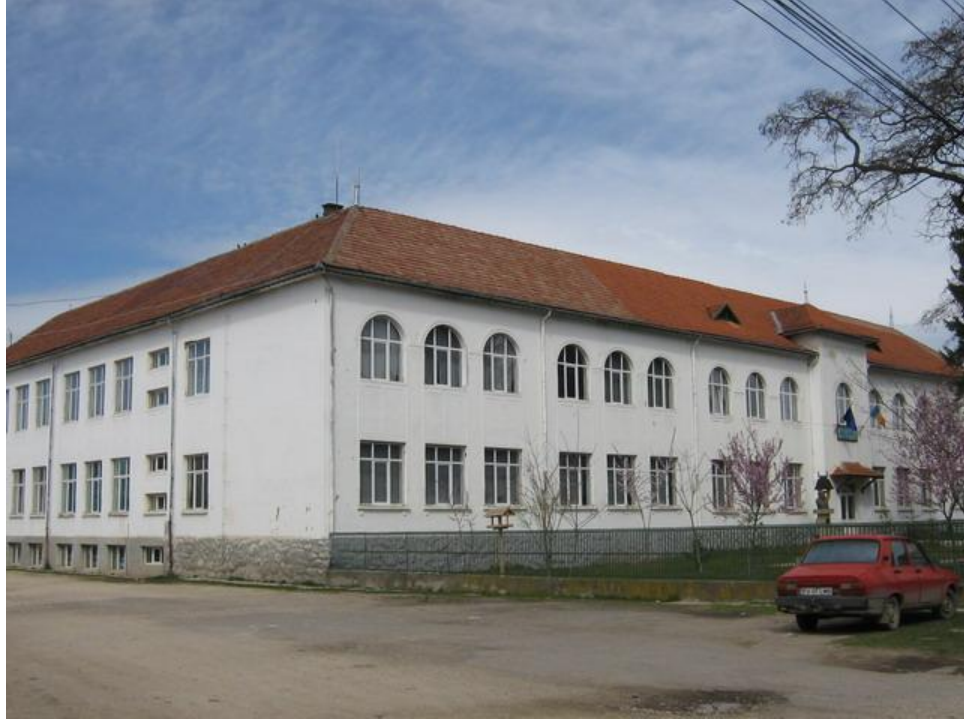
Clădirea școlii în anul 2007