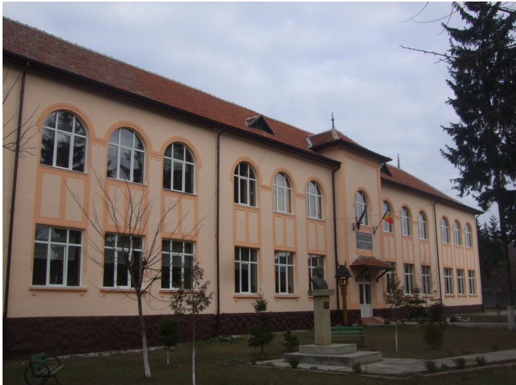
Școala în prezent