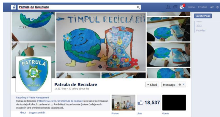
➔ Diseminarea mesajelor prin pagina de Facebook a Patrului de Reciclare cu 18,565 utilizatori conectați