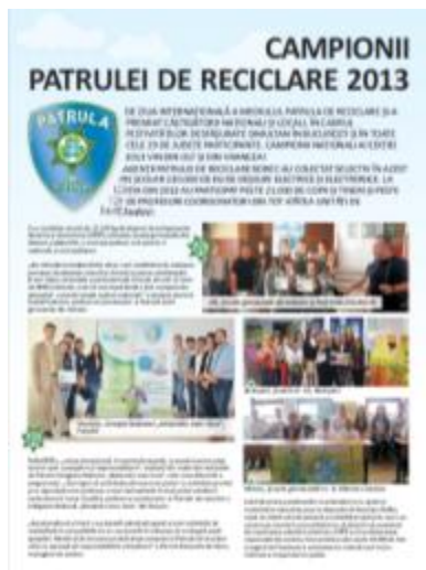
➔ Campanii de PR în presa locală