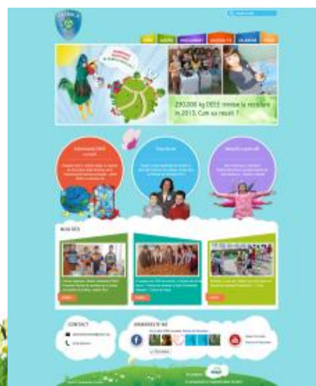
➔ Website dedicat actualizat permanent cu informații și noutăți