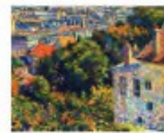
Charles Angrand: Aratás