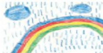
Theodor Pallady: Tájkép Dél-Franciaországból

3. Soroljatok fel néhány természeti formát!