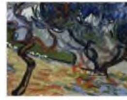
Theodor Pallady: Tájkép házakkal